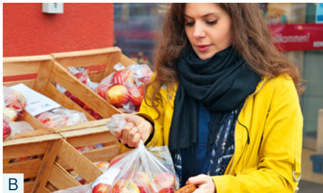
Sie kauft im Supermarkt ein.